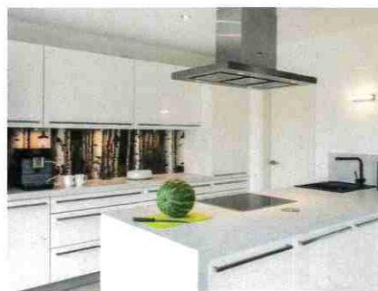
Blickfang in der in Weiß gehaltenen Küche ist das Dekor der Wand.

Bereits vom Eingang aus können die Eheleute durch den Flur über den Essbereich hinweg in den Garten blicken. Vorbei an Gästezimmer und Gästebad